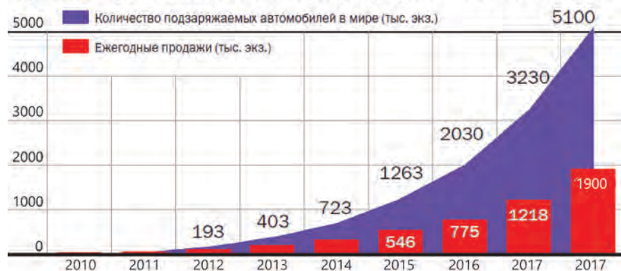
Динамика роста глобального парка подзаряжаемых автомобилей

Именно Changan Automobile Group выпустила в 2012 году первый китайский электромобиль, получивший пять звезд в тестах по безопасности, – Changan E30. Сегодня компания включает шесть производственных площадок на территории Китая, а также 15 заводов, изготавливающих автомобили и двигатели за пределами страны. Эти мощности позволяют