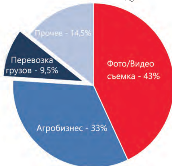
Использование дронов по отраслям в 2017 году

беспилотников уже есть. Любимый зрителями не только в Узбекистане, но и других странах СНГ документальный фильм «Узбекистан. Жемчужина песков», показанный на канале «Россия 1» и снятый российской кинокомпанией «Мастерская», невозможно представить без потрясающих и необычных ракурсов древних памятников страны, снятых с беспилотников.